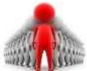
СХЕМА ВЫЯВЛЕНИЯ ОБЩЕСТВЕННОГО МНЕНИЯ